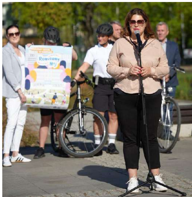
Burmistrz Ewa Ostrowska podczas inauguracji "Rowerowego Maja"

Złożyliśmy wnioski na dofinansowanie rewitalizacji części obszaru plaży miejskiej i czekamy na rozstrzygnięcie, miejmy nadzieję korzystne dla Giżycka. W międzyczasie samodzielnie poprawiamy estetykę plaży i przyległego terenu. Od przejścia pod torami do