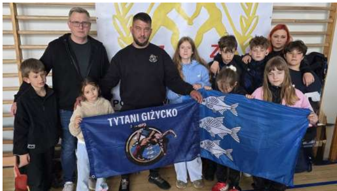
Silna brygada w Teresinie...

Na co dzień są "rasowymi wolniakami", ale gdy tylko sytuacja tego wymaga, błyskawicznie przeobrażają się w "klasyków" i także świetnie dają sobie radę. Mowa, oczywiście, o zapaśnikach Klubu Sportowego "Tytani" Giżycko, którzy w ostatnich tygodniach powiększyli dorobek "Mazurskich Wilków" o dwa medale.