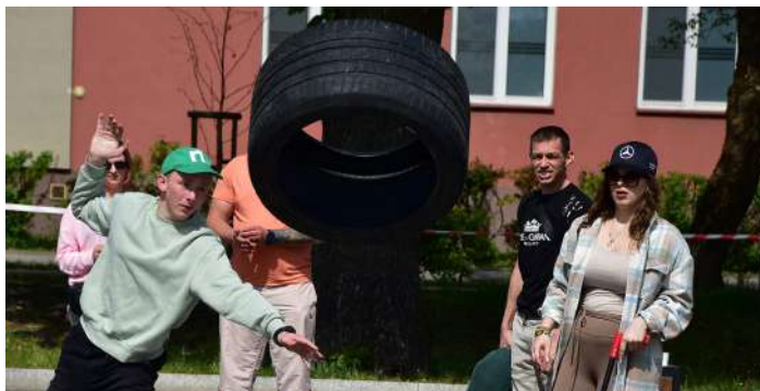
Rzut oponą i car limbo, czyli cisnąć jak najdalej i przejechać jak najniżej. W tej drugiej konkurencji dozwolone jest obciążanie samochodu