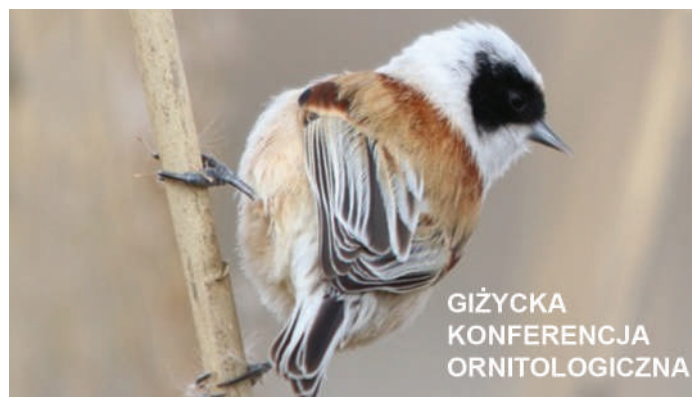
GIŻYCKA KONFERENCJA ORNITOLOGICZNA

Czy pierwsza może zastąpić drugą? Odpowiedź na to i wiele innych pytań poznamy już 20 czerwca (godz. 9.00) podczas jubileuszowej 10. Giżyckiej Konferencji Ornitologicznej, która odbędzie się w Państwowej Szkole Muzycznej. Spotkanie będzie zarazem okazją do podsumowania pięcioletniej działalności Stowarzyszenia Miłośników Mazurskiej Przyrody w zakresie edukacji przyrodniczej oraz promowania walorów przyrodniczych Warmii i Mazur. Wstęp na konferencję wolny, ale z racji ograniczonej liczby miejsc w sali PSM wymagana jest rezerwacja (kontakt - tel. 507-958-362, e-mail: mazurskaprzyroda@gmail.com), której nie radzimy odkładać na ostatnią chwilę.