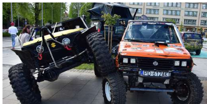
Uspokajamy Czytelników o słabych nerwach - w tej "kraksie" nikt nie ucierpiał