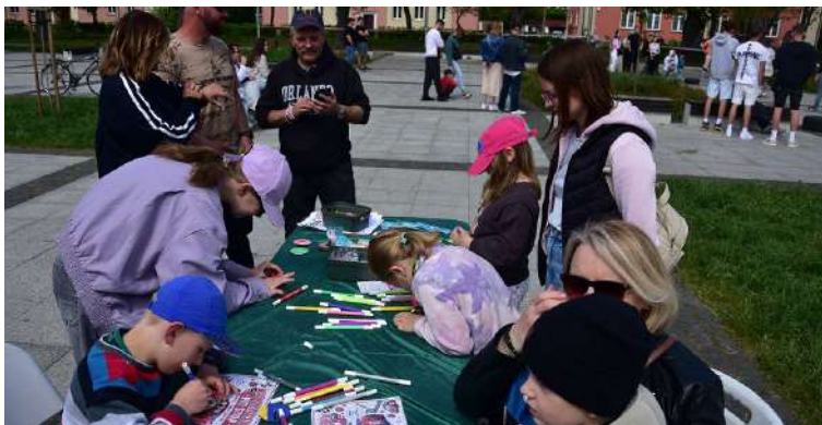
Najmłodszy przelewali na papier swoje pomysły na wymarzony samochód

"Wydarzenie dla ludzi, których łączy pasja do samochodów, tuningu i dobrej atmosfery, spotkanie właścicieli ciekawych projektów, miłośników motoryzacji i wszystkich, którzy chcą spędzić czas wśród wyjątkowych aut i w pozytywnym klimacie" - tak tegoroczny "Mazury Tuning Fest" zapowiadali organizatorzy imprezy na Placu Piłsudskiego. Zapowiedzi w pełni pokryły się z rzeczywistością. Kilkogodzinny festyn motoryzacyjny przyciągnął na plac wielu Giżycczan, którzy nie tylko mieli okazję podziwiać świetnie przygotowane pojazdy "po liftingu", ale także obejrzeć ciekawe pokazy i liczne konkursy (w niektórych sami mogli wziąć udział).