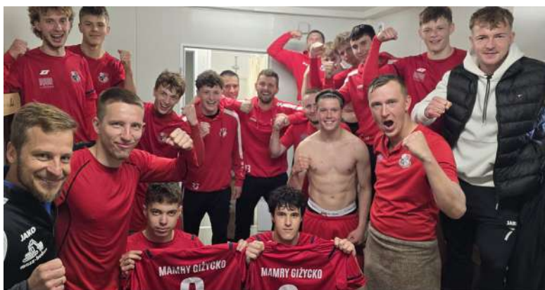
Radość piłkarzy Mamr Giżycko po wygranym 8:2 meczu z outsiderem GKS Stawiguda