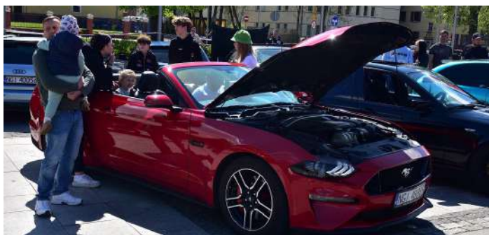
"Zimny łokieć" i wiatr we włosach. Kto przejechałby się takim "wózkiem"?